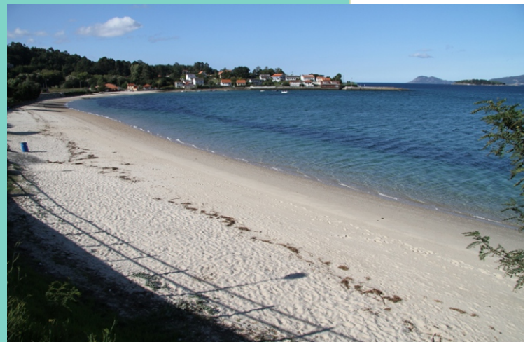
Praia Boa Grande