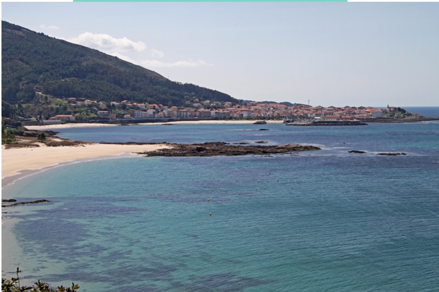
Porto do Son