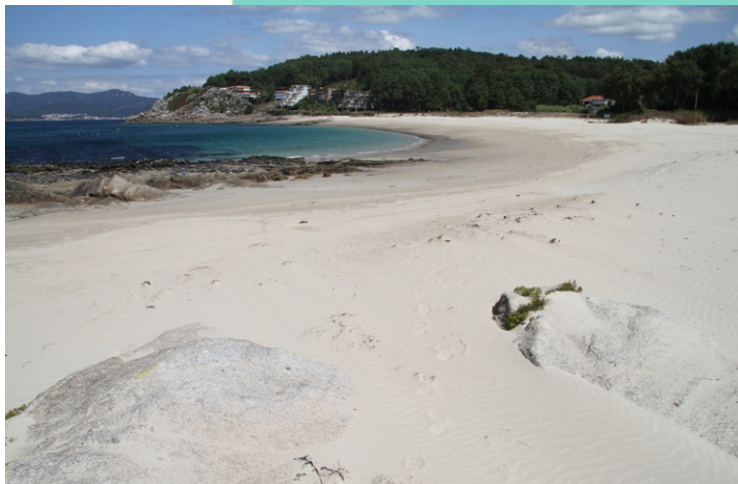
Praia de Cabeiro