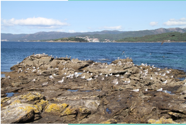
Punta da Gata