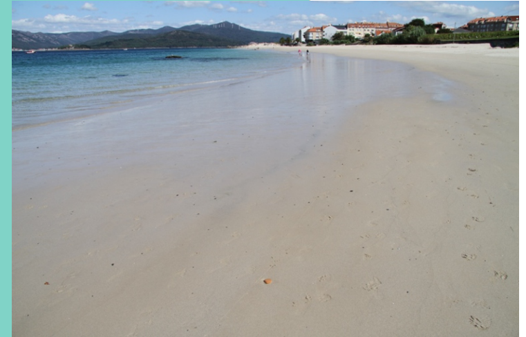
Praia de Coira