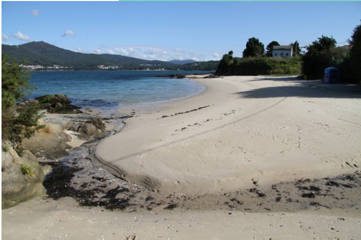
Praia Boa Pequena