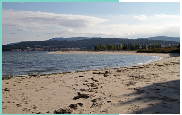
Praia do Testal