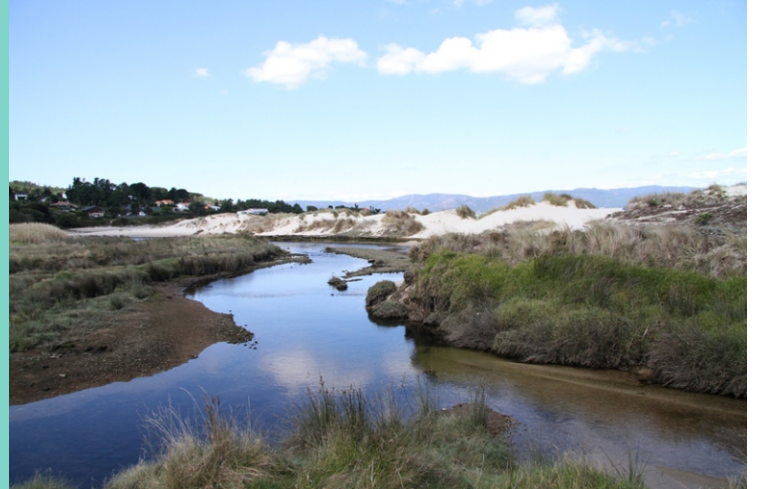
Río de Cans