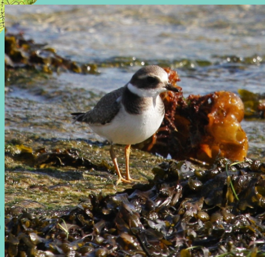
Píllara ( Charadrius hiaticula )