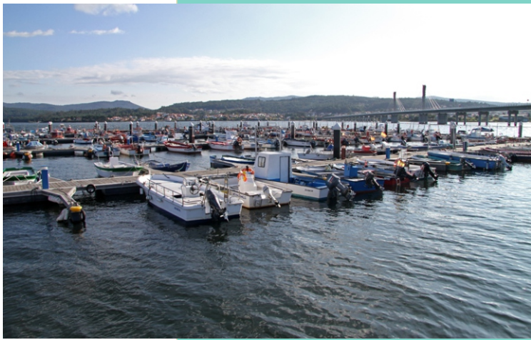
Porto do Testal. Ao fondo Noia e a ponte que cruza a ría.