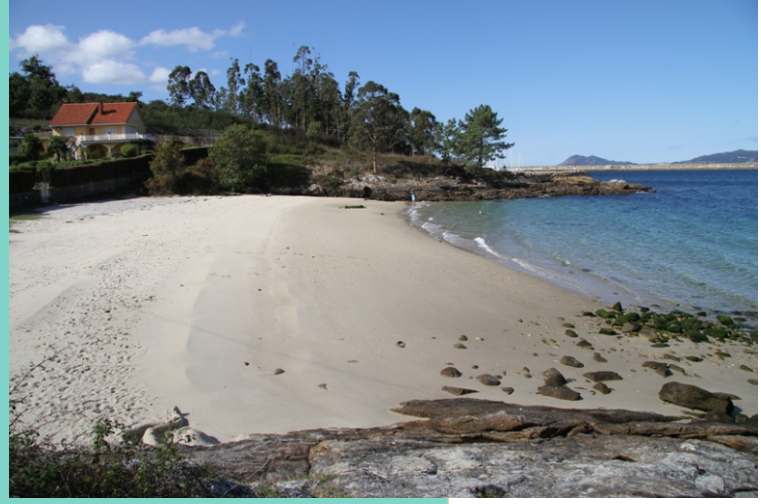
Praia da Gata