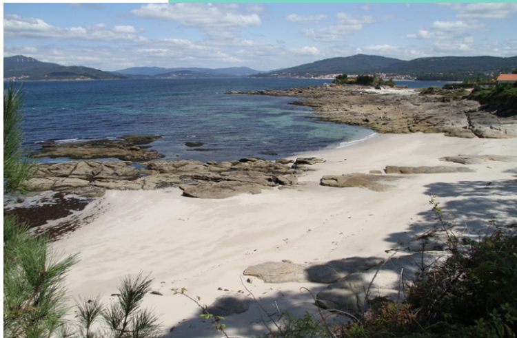
Praia do Pozo e Punta Aqueira