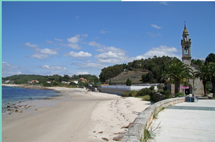
Praia de Suaigrexia