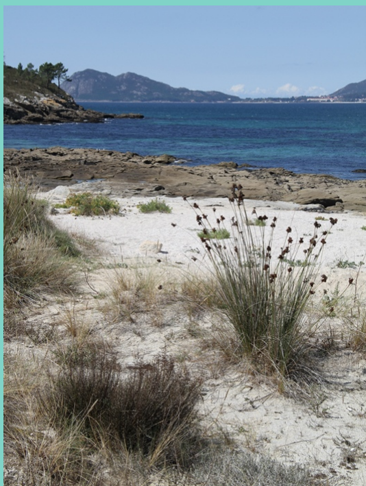
Vista desde Punta Agueira. Ao fondo punta Cabeiro e Monte Loura