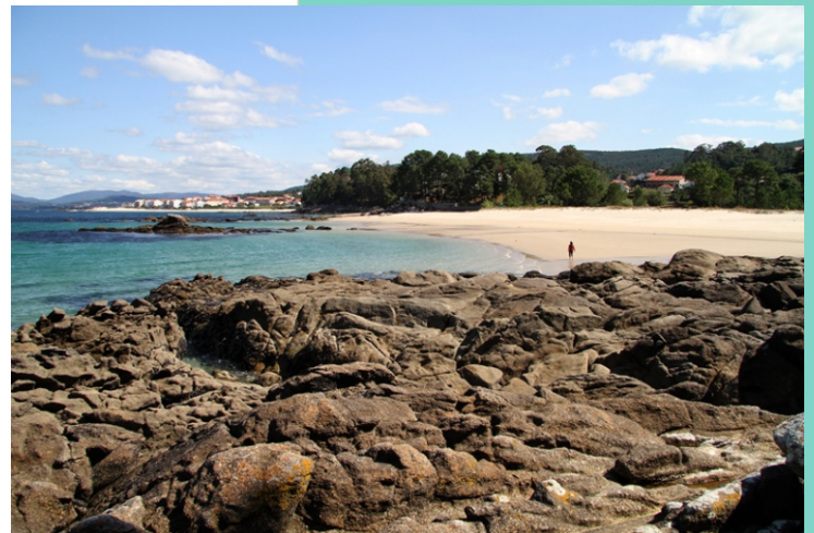
Praia de Langaño